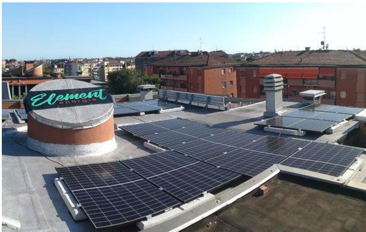
L'impianto di pannelli solari installato sul tetto della nostra sede, a Milano, in Via Carnia, 20

All'interno degli articoli pubblicati su IdeeGreen.it abbiamo inoltre cercato di far capire l'importanza dei risparmi conseguiti grazie al nostro impianto fotovoltaico, in termini di riduzioni di emissioni, anche sfruttando le informazioni e i grafici messi a disposizione dell'App SolarEdge che ci permette di monitorare il buon funzionamento dell'impianto.