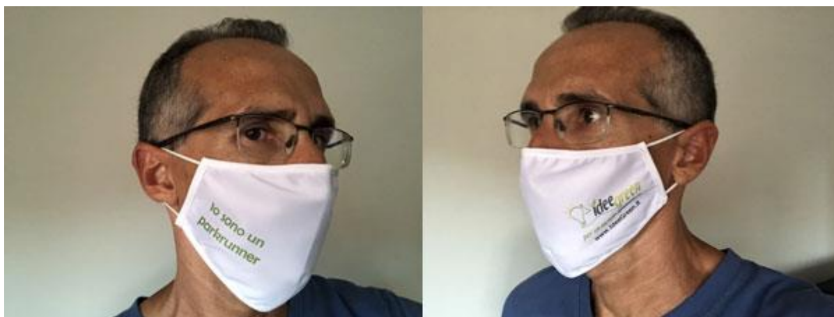
Una delle 200 mascherine donate ai parkrunner durante l'emergenza COVID-19

Tra le prime attività, particolarmente apprezzata, l'acquisto e la distribuzione in omaggio a tutti i frequentatori dell'evento parkrun di 200 mascherine protettive adatte alla corsa, con la scritta "Io sono un parkrunner" e il nostro logo, così offrire una protezione al Coronavirus a tutto il nostro gruppo.